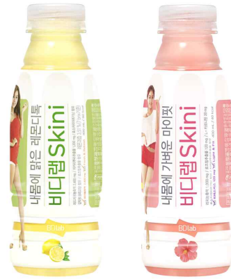
Fig. 3. Detox drinks containing food ingredients for detoxification through lipolysis and anti-oxidation.

체내 디톡스 시스템에 손상을 주고 소화불량 및 면역 약화 등을 초래하므로 디톡스 식품소재로 정신건강을 잘 유지해야 한다.