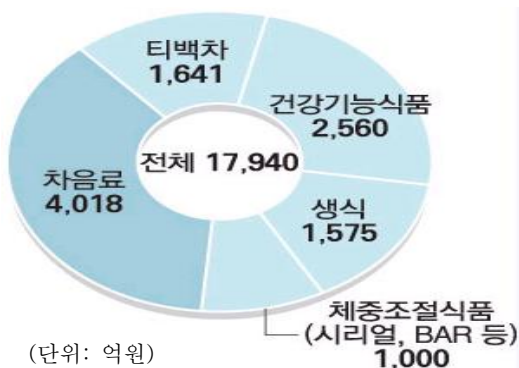
그림 2. 다이어트 음료 시장 규모 (2010년 기준)

2000년대 이후 소득수준이 향상되면서 건강에 대한 관심이 높아지고 건강 지향적인 마인드의 증가, 문화 상품으로서의 인식 등 웰빙 식품(28)에 대한 소비 확대가 이루어지고 있다. 식용식물을 활용한 다양한 가공방법의 차를 이용하고 있지만, 장수, 미용, 정신적 스트레스 완화,