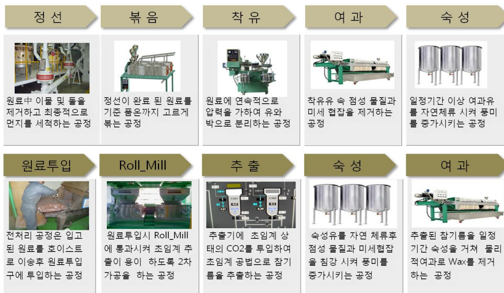
그림 2. 압착식 참기름 제조공정 (위) 및 초임계 참기름 제조공정 (아래) 모식도

특히 여과 전 숙성탱크의 반제품 분석을 통하여 벤조피렌의 농도에 따른 적합한 흡착여과조건을 개별적으로 적용하여 여과를 실시하게 되므로 최소한의 여과공정으로