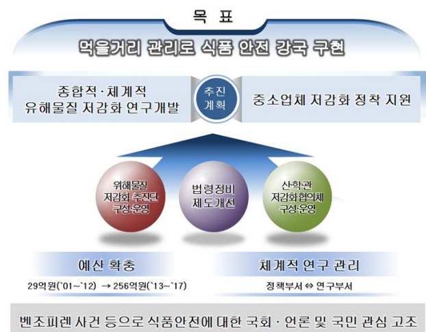
그림 2. 벤조피렌 저감화 전략 요약

식약처는 벤조피렌을 포함한 식품 제조·가공·조리 중 자연 발생하는 유해물질의 저감화를 위해 연구개발 사업과 중소기업 지원 정책 사업을 병행하여 실시하고 있다. 이는 그간의 유해물질 저감화를 위한 노력에도 불구하고, 식품 중 벤조피렌이 검출되는 사건 등으로 인한 국민의 불안감이 고조되는 상황을 사전에 예방하기 위하여 중장기적으로 종합적·체계적인 유해물질 저감화 계획을 수립하여 추진하는 것이다. 동 유해물질 저감화를 원활하게 추진하기 위해서 식약처 내부 ‘유해물질 저감화 추진단’과 민관 합동 ‘유해물질 저감화 협의회’를 구성·운영하고, 식품위생법 개정 추진을 통해 유해물질 저감화 관련 사업의 법적 근거를 마련할 것이다. 결론적으로 식약처는 벤조피렌을 포함한 유해물질 저감화 사업의 성공적인 추진을 통해 국정과제 중 하나인 ‘먹을거리 관리로 식품안전 강국 구현’을 실천하는데 일조할 것이다(그림 2).